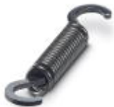
Mola de retenção de reposição

Mola de reposição - CRIMPFOX/ SPR-3 - 1212036