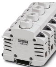
Bornes de fusível para peças para fusível NEOZED

Note que os dados aqui indicados foram obtidos do catálogo online. Para informações e dados completos, consulte a documentação do usuário. Aplicam-se as Condições Gerais de Utilização para downloads da Internet. ( http://phoenixcontact.pt/download )