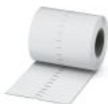
Folha de identificação para tira Zack, Rolo, branco, não impresso, identificável com: THERMOMARK ROLL, THERMOMARK ROLL X1, THERMOMARK ROLLMASTER 300/600, THERMOMARK X1.2, THERMOMARK S1.1, tipo de montagem: cola, para a largura de terminal: 104 mm, tamanho para gravação: 104 x 3,8 mm

Folha de identificação para tira Zack - TML (104X3,8)R - 0801833