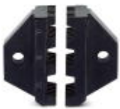
Matriz de reposição para CRIMPFOX 25R

Matriz de reposição - CRIMPFOX 25R/DIE - 1212040