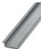
Trilho de fixação com perfil em U, material: galvanizado, não perfurado, altura 7,5 mm, largura 35 mm, comprimento: 2 m

Trilho de fixação não perfurado - NS 35/ 7,5 ZN UNPERF 2000MM - 1206434