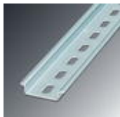
Perfil em U 35 mm (NS 35)

Trilho de fixação perfurado - NS 35/ 7,5 WH PERF 2000MM - 1204119