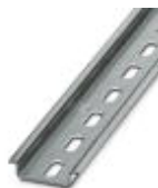
Trilho de fixação com perfil em U, material: galvanizado, perfurado, altura 7,5 mm, largura 35 mm, comprimento: 2 m

Trilho de fixação perfurado - NS 35/ 7,5 ZN PERF 2000MM - 1206421