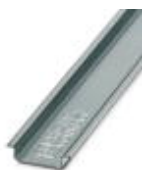
Perfil em U 35 mm (NS 35)

Trilho de fixação - NS 35/ 7,5 WH UNPERF 2000MM - 1204122