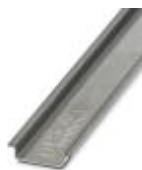
Trilho de fixação não perfurado, Largura: 35 mm, Altura: 7,5 mm, Comprimento: 2000 mm, Cor: cores prat.

Trilho de fixação não perfurado - NS 35/ 7,5 AL UNPERF 2000MM - 0801704