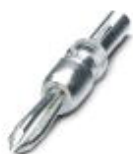
Plugue de teste, Cor: prata