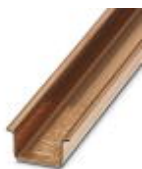
Trilho de fixação com perfil em U, material: cobre, não perfurado, 15 mm de espessura, altura 15 mm, largura 35 mm, comprimento: 2 m

Trilho de fixação não perfurado - NS 35/15 CU UNPERF 2000MM - 1201895