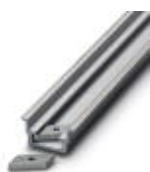
Trilho de fixação, extrusado, versão alta, não perfurado, espessura 1,5 mm, material: alumínio, altura 15 mm, largura 35 mm, comprimento 2000 mm

Trilho de fixação não perfurado - NS 35/15 AL UNPERF 2000MM - 1201756