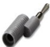
Conector redutor, Cor: cinza