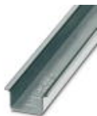
Perfil em U 35 mm (NS 35)

Trilho de fixação - NS 35/15 WH UNPERF 2000MM - 1204135