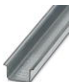
Trilho de fixação com perfil em U, material: galvanizado, não perfurado, altura 15 mm, largura 35 mm, comprimento: 2 m

Trilho de fixação não perfurado - NS 35/15 ZN UNPERF 2000MM - 1206586