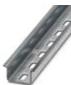
Trilho de fixação com perfil em U, material: galvanizado, perfurado, altura 15 mm, largura 35 mm, comprimento: 2 m

Trilho de fixação perfurado - NS 35/15 ZN PERF 2000MM - 1206599