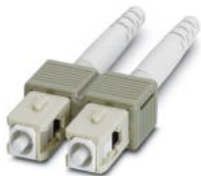
Conector SC-Duplex, com proteção longa contra dobras, para multimodo 50/125 µm, bege

Note que os dados aqui indicados foram obtidos do catálogo online. Para informações e dados completos, consulte a documentação do usuário. Aplicam-se as Condições Gerais de Utilização para downloads da Internet. ( http://phoenixcontact.pt/download )