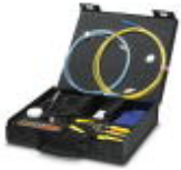
Kit de ferramentas para confecção GOF

Conjuntos de ferramentas - FOC-TOOL-GOF KONF SET - 1411049