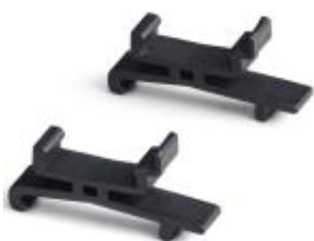
Adaptador para montagem em trilho de fixação.

Note que os dados aqui indicados foram obtidos do catálogo online. Para informações e dados completos, consulte a documentação do usuário. Aplicam-se as Condições Gerais de Utilização para downloads da Internet. ( http://phoenixcontact.pt/download )